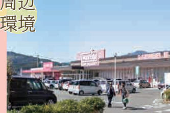
マックスバリュ伊万里駅前店…徒歩 1分