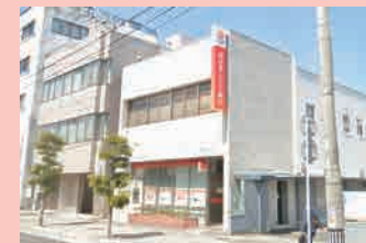
西日本シティ銀行…徒歩 4分