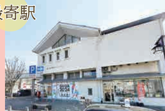
JR 筑肥線「伊万里駅」…徒歩 2分