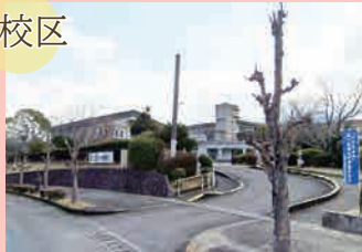
立花小学校…徒歩 23分