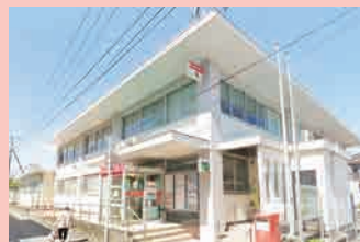
伊万里郵便局…徒歩 6分