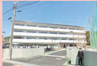
伊万里中学校…徒歩 19分